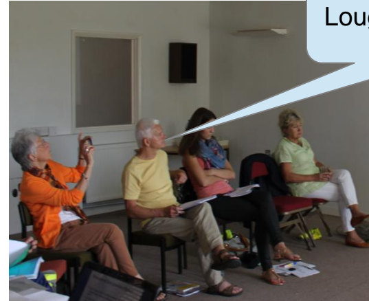
Loughton, Lipiec 2013