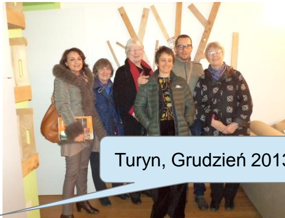
Turyń, Grudzień 2013