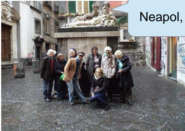
Neapol, Luty 2013